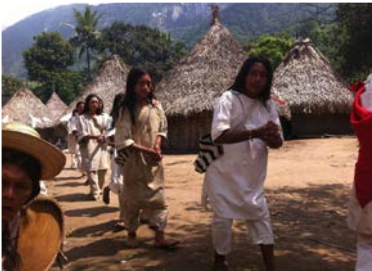
Baile Kogui.

Por otra parte se hacen con los cantos y las danzas ancestrales que - dicen ellos - se les fueron entregados al origen, y culminan en sus celebraciones, después de los solsticios de invierno y de verano. Tuvimos el privilegio inmenso de poder asistir y participar en dos fiestas de verano, donde se hacen bailes y cantos para cada cosa y cada familia de especies (el agua, las aves, el murciélago, plantas, etc.).