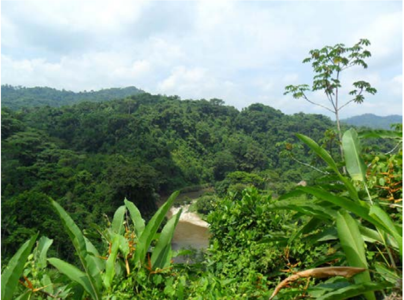
Cuenca de Palomino, Sierra Nevada de Santa Marta

encuentra ubicada Nabusímake conocida como la capital espiritual de este grupo donde habitan cerca de 34.000 indígenas. Los Wiwa encuentran localizados en la parte sur - oriental y el norte de la sierra correspondientes al departamento del Cesar en la cuenca media -alta del río ranchería, otra parte de esta comunidad se localiza en el departamento del Cesar en la Serranía del Perijá y en la Guajira en los municipios de Dibulla, San Juan del cesar y Riohacha y en el departamento del Magdalena cerca de Santa Marta siendo un pueblo de aproximadamente 18000. Los Kogui que habitan principalmente la vertiente norte entre los departamentos del Magdalena, La Guajira y el Cesar en el resguardo Kaggabba - Malayo- Arhuaco y se han censado cerca de 16.000 indígenas pertenecientes a esta comunidad 1 .