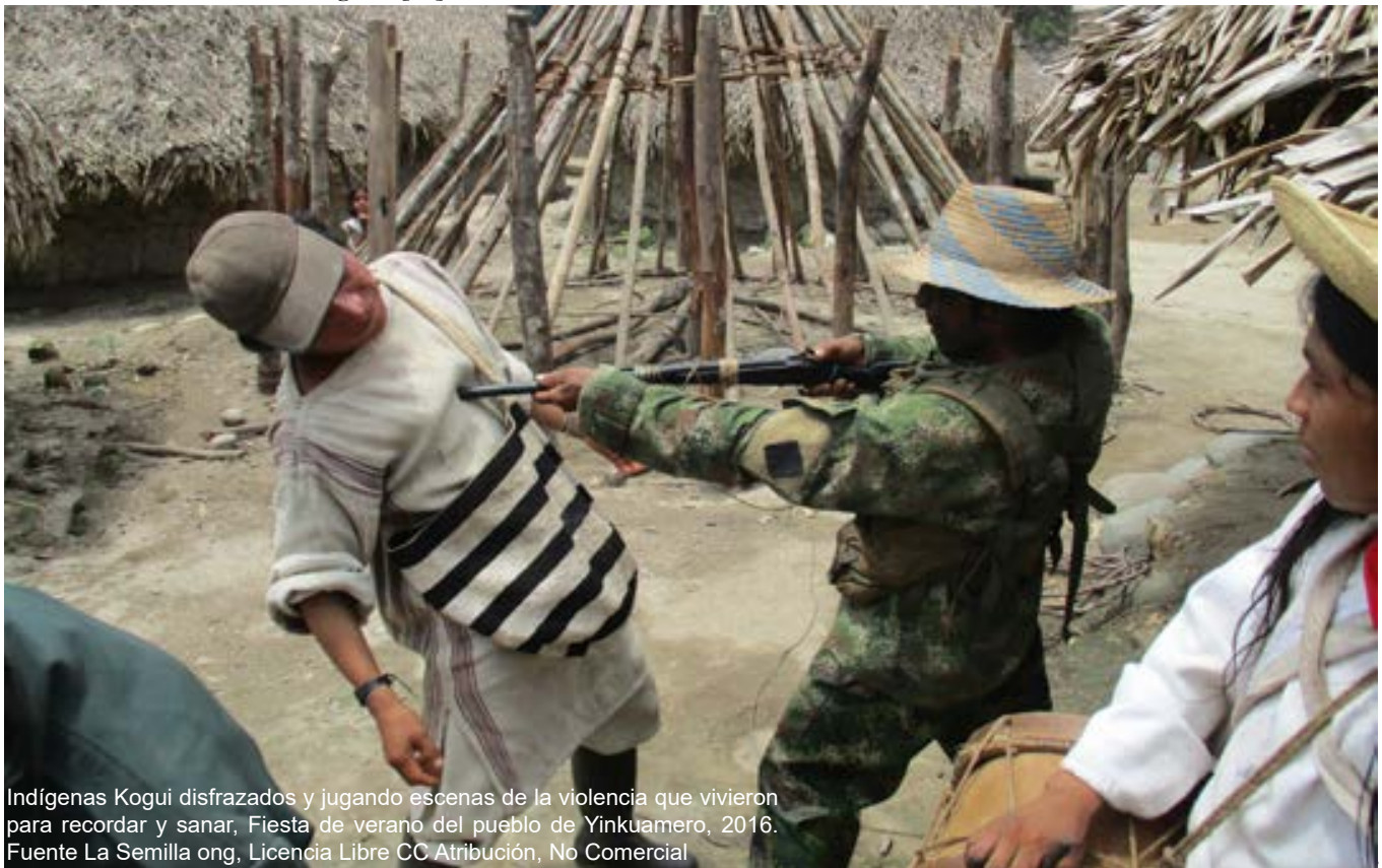
Indígenas Kogui disfrazados y jugando escenas de la violencia que vivieron para recordar y sanar, Fiesta de verano del pueblo de Yinkuamero, 2016. Fuente La Semilla ong, Licencia Libre CC Atribución, No Comercial

Hoy en día hay múltiples agresiones y afectaciones [*] que continúan ocurriendo hoy en la Sierra Nevada (megaproyectos, presencia grupos armados ilegales, asesinato de líderes indígenas y ambientalistas, etc.), y sin embargo este pueblo milenario ha sido capaz de resistir y sobrevivir de manera pacífica buscando siempre responder a la violencia sin violencia, cómo lo expresa el mamó Arhuaco José Romero en el documental “Resistencia en la línea negra” [**].