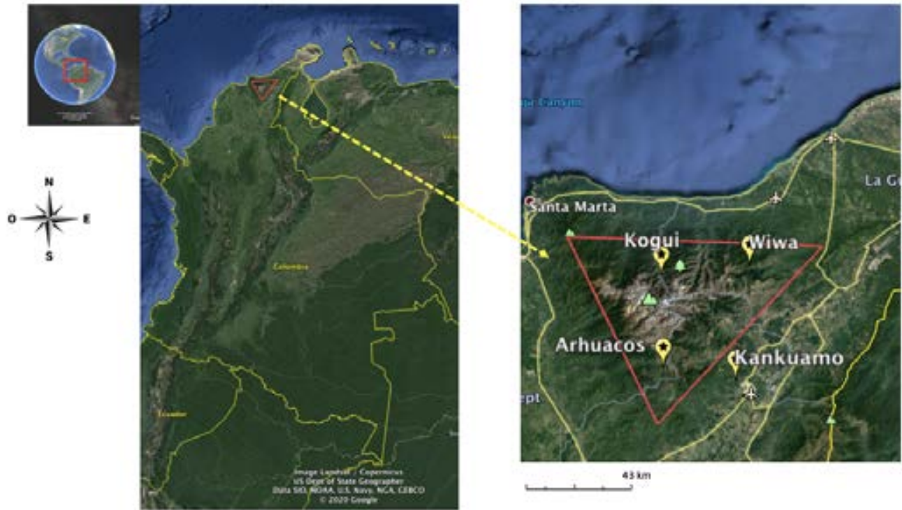
Mapa de localización de la SNSM y sus cuatro pueblos indígenas

Para la época fueron construidos adaptados al paisaje circundante y evitando la erosión de la tierra y daños a la biodiversidad y en la actualidad los pueblos emergentes siguen esta costumbre.